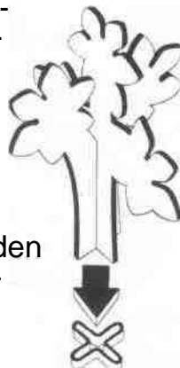
Abb. 1 b