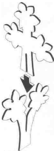
Abb. 1 a