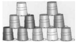
Ein blauer Eimer wurde entfernt werden und darüber alle von ihm gestützten.

Sobald der Spieler die betroffenen Eimer entfernt hat, werden alle ausgespielten Karten offen auf einen Ablagestapel gelegt.