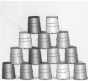
Der Spieler mußte einen grünen Eimer entfernen - den oberen natürlich.