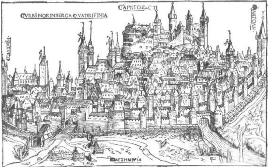
Ansicht der freien Reichsstadt Nürnberg. Nach einem Holzschnitt von Wohlgemuth.