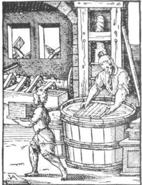
Papyrer, d.h. Papierhersteller. Nach einem Holzstich von Jost Amman.