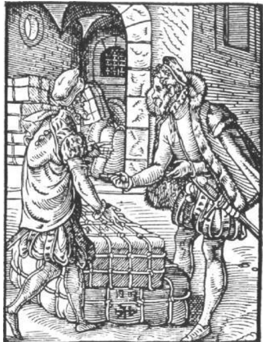
Kaufleute bei der Arbeit. Nach einem Holzstich von Jost Amman