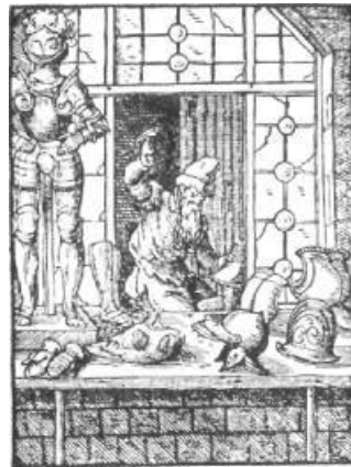
Die Plattner, Hersteller von Rüstungen, nach einem Holzschnitt von Jost Amman