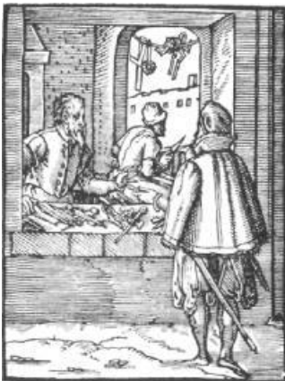
Zirkelschmiede, nach einem Holzschnitt von Jost Amman

Zu großem Ansehen brachten die Nürnberger es vor allem in der Metallverarbeitung. Exportschlager waren hier aber nicht nur die Erzeugnisse der bereits erwähnten Plattner, Harnischmacher und Schwertfeger. Die Nadlersgasse, die Pfannenschmieds- und Beckschlagergasse zeugen von der Vielfalt des metallverarbeitenden Gewerbes. Die in Deutschland einzigartige Bezeichnung „Zirkelschmiedsgasse“ signalisiert, in welcher Häufung allein diese hochspezialisierte Gruppe von Metallhandwerkern in Nürnberg vertreten war.