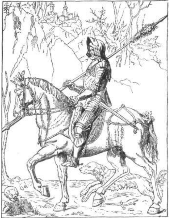
Für Sicherheit und Schutz im Zeichen der Burg sorgten u.a. die sog. „Reisigen“.