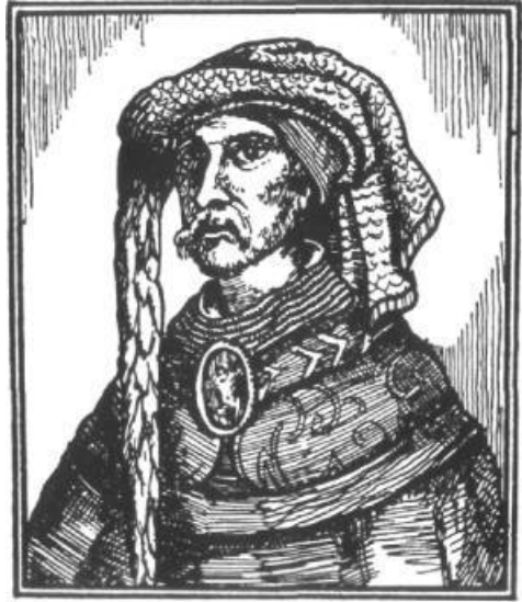
Epelein von Gailingen

E iner der berühmtesten Raubritter war jener Epelein von Gailingen, den die Nürnberger einst geschnappt hatten und der dann, so sagt die Legende, mit einem mächtigen Sprung seines Pferdes über den Burggraben seinen städtischen Häschern wieder entkam. Die Nürnberger zeigen heute noch gern den „Hufabdruck“, den Epeleins Pferd an der nördlichen Burggrabenmauer hinterlassen haben soll. Aus jener Zeit stammt übrigens auch der Spruch: „Die Nürnberger hängen keinen, sie hätten ihn denn.“