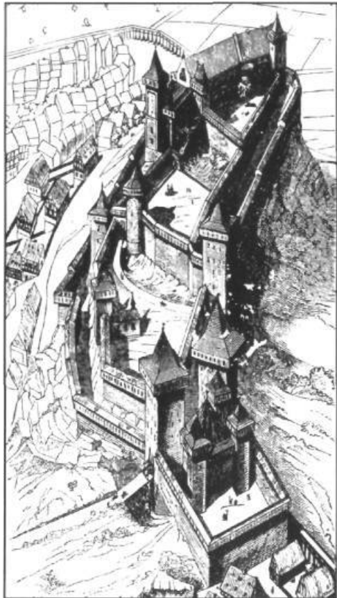
Die frühe Ansicht der Burg zu Nürnberg. Nach einer Rekonstruktion des August von Essenwein.

Die Entwicklung der Stadt ging von der schützenden Burg aus. Der Burgberg bot seinen Anwohnern aber nicht nur Schutz, sondern auch ein solides Fundament für ihre Häuser. Weniger verlockend erschienen da zunächst wohl die sumpfigen und schwemmsandreichen Ufergebiete der Pegnitzauen. Nürnberg, ehemals nichts anderes als ein königliches Krongut, wuchs erst allmählich von der Sebalder Seite, nördlich der Pegnitz, hinüber zur jenseits des Flusses gelegenen Lorenzer Seite. Die Fundamente zu beiden Seiten der Pegnitz mussten nicht selten auf tief in den Boden hinein getriebene Holzpfähle gestellt werden, um einigermaßen festen Halt zu finden.