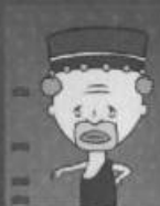
Insulaner von Tungupungu