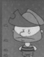
Lutz der Pirat