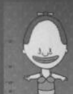
Insulanerin von Tungupungu