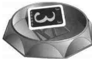
b. Karte schräg in Arena = falsch