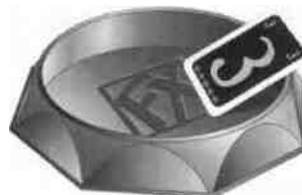
c. Karte liegt auf Rand auf = falsch

Provokateur macht Angebot, Mitspieler können reagieren