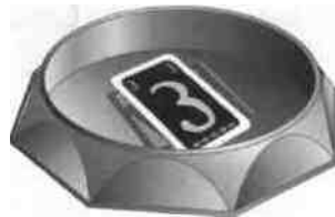
a. Karte flach in Arena = richtig

Karten, die neben der Kartenarena landen, werden aus dem Spiel genommen, ebenso Karten, die schräg in der Arena stehen und auf dem Rand aufliegen. (Abb. b/c)