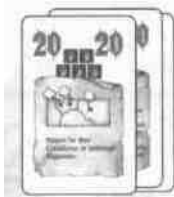
je 18 Aktionskarten in 5 Farben

Die Macht- und Aktionskarten von EL GRANDE werden durch diesen Kartensatz ersetzt. Das heißt, sämtliche Regeln von EL GRANDE , die sich auf die Macht- und Aktionskarten beziehen, werden durch diese Regeln ersetzt. Der Kartensatz enthält im einzelnen: