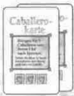
5 Caballero- karten