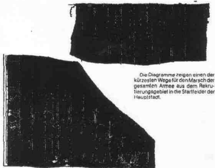
Die Diagramme zeigen einen der kürzesten Wege für den Marsch der gesamten Armee aus dem Rekrutierungsgebiet in die Startfelder der Hauptstadt.

Bevor ein „neuer“ General und seine Armee in neue Feindseligkeiten eintreten können, müssen sie in Richtung auf die Hauptstadt „mobil-machen“. Der Spieler muß demnach die nächsten Runden darauf verwenden, seine Armee aus dem Rekrutierungsgebiet in die Startfelder seiner Hauptstadt zu bringen.